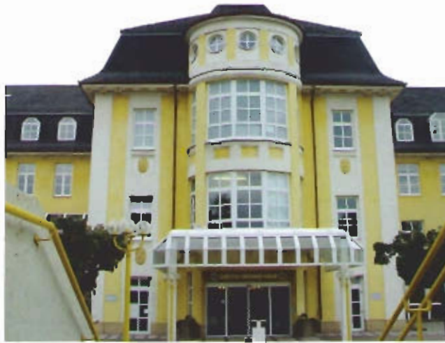
Hinter der unscheinbaren Fassade des Dillinger Caritas-Krankenhauses verbirgt sich ein modernes Teleradiologie-Dienstleistungszentrum.

Vorgefertigte Masken bieten dem Befunder alle relevanten Daten. Er braucht sich nicht darum zu kümmern, wo die Bilder herkommen und wo der Befund hingehet.